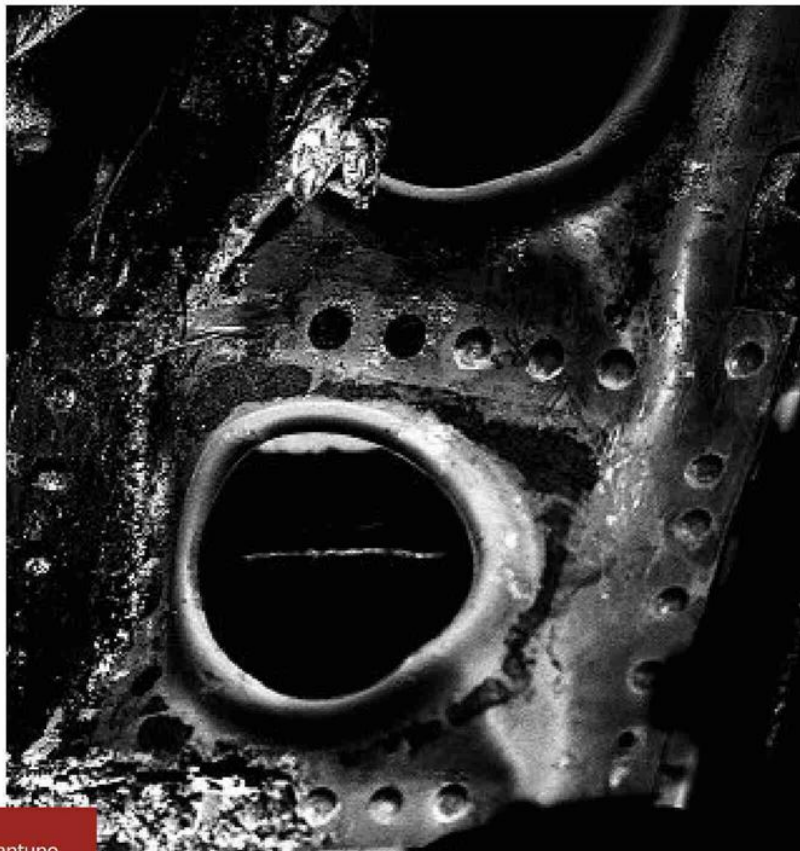
Album Tre degli ottantuno scatti che compongono «Stragedia», l'opera di Nino Migliori che ha fotografato nei capannoni i resti del DC9